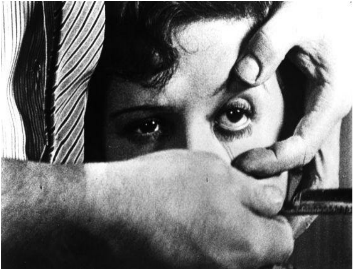
Fotograma de Un perro andaluz, de Luis Buñuel (1929)

La película es una de las obras cumbre del surrealismo. A su estreno, en París, asistieron 31 aristócratas, escritores y pintores. Entre ellos estaba Pablo Picasso.