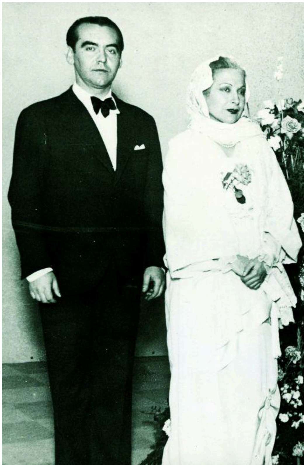
Federico García Lorca y la actriz Margarita Xirgu en 1935