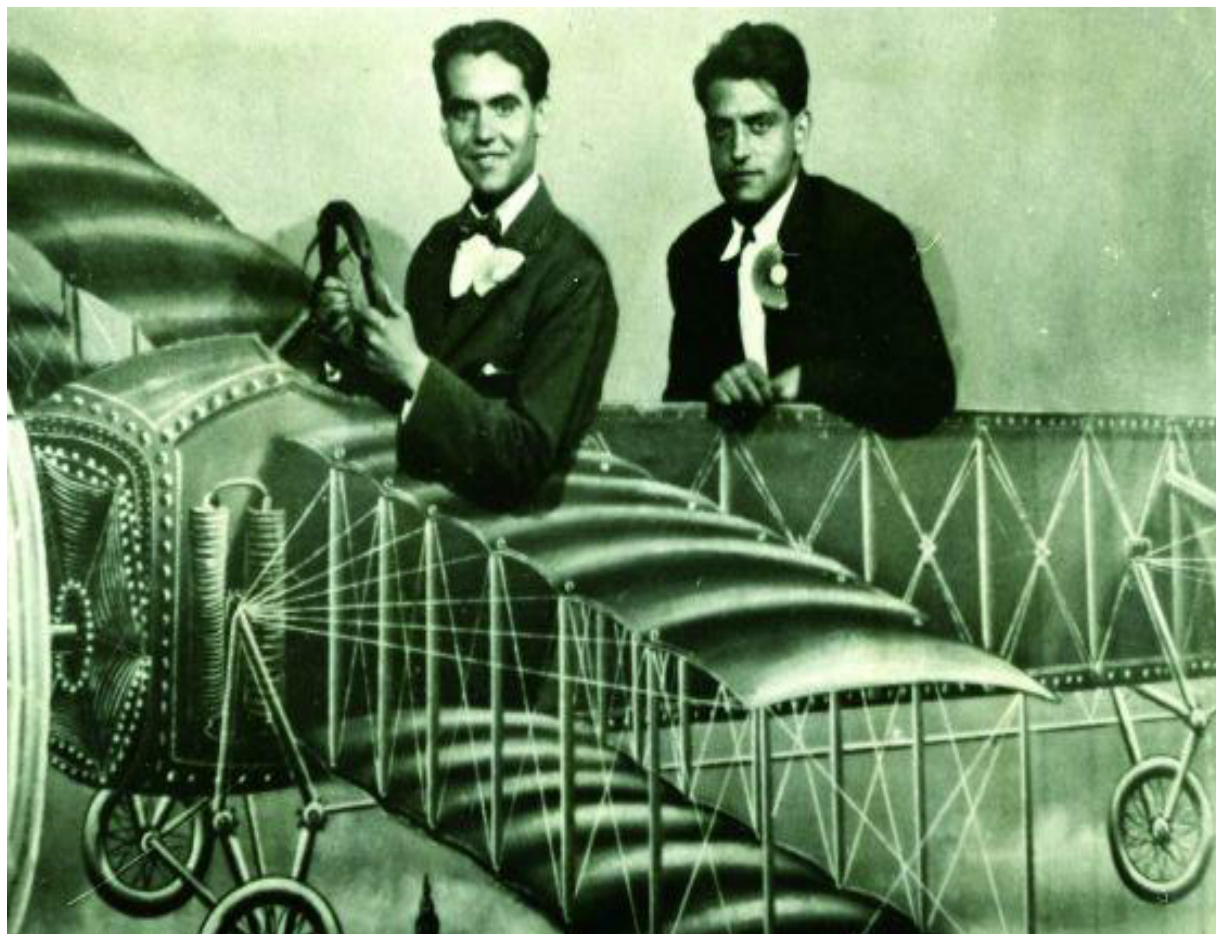
Federico García Lorca y Luis Buñuel en las fiestas de San Antonio de la Florida. Madrid, 1923